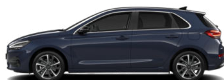
Sailing Blue Pearl