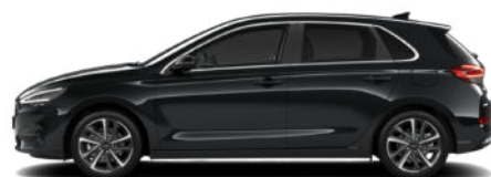
Abyss Black Pearl