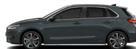
Cypress Green Pearl