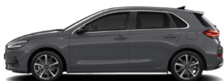
Ecotronic Grey Pearl