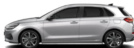
Shimmering Silver Metallic