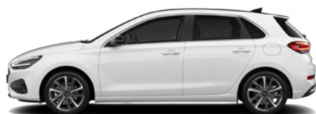
Serenity White Pearl