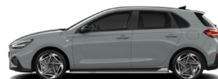
Shadow Grey nur für N Line