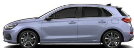
Meta Blue Pearl