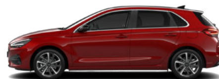
Ultimate Red Metallic