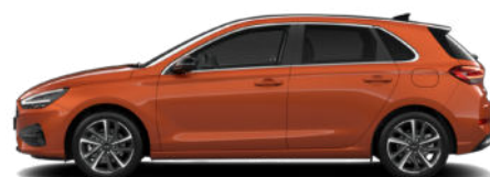
Jupiter Orange Metallic