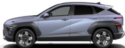
Meta Blue Pearl nicht verfügbar für N Line