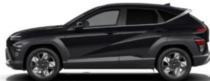
Abyss Black Pearl nicht verfügbar für Hybrid