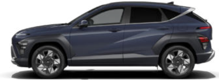
Denim Blue Pearl