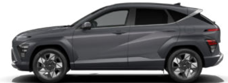
Ecotronic Gray Pearl