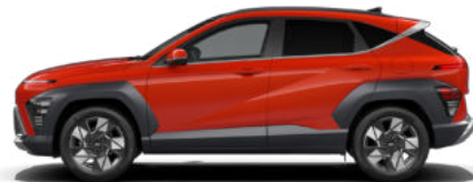
Soultronic Orange Pearl nicht verfügbar für Benzin und N Line