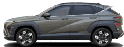
Amazon Gray Metallic (nicht verfügbar für Hybrid und N Line)