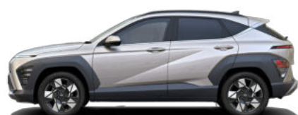
Shimmering Silver Metallic nicht verfügbar für Hybrid