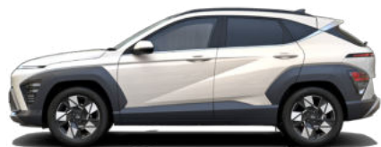
Serenity White Pearl nicht verfügbar für Hybrid