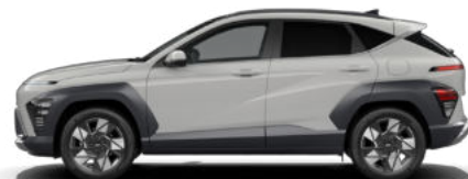
Cyber Gray Metallic